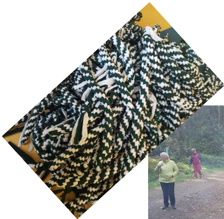
Yläpuolella kässäkerhon Reumaliitolle tekemiä töitä lasten ensipakkaukseen.