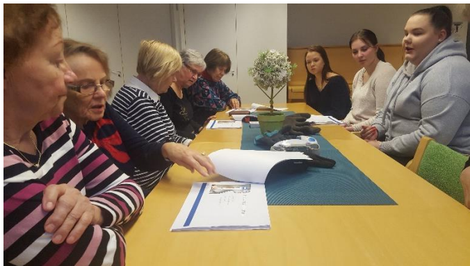
Lähihoitajaopiskelijoiden opissa Onnensillassa