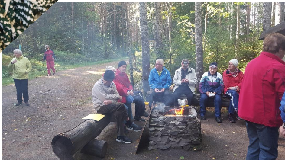
Vieressä retkeillään Ladun Majalla.